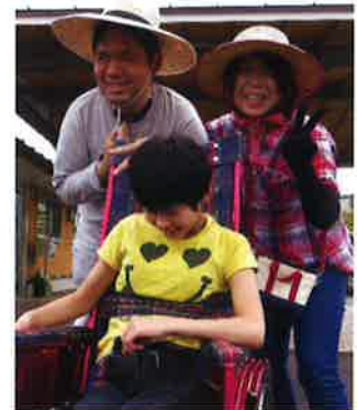
かつどう づく じかん ま 〔エコラフト活動〕バックやカゴを作っています。時間があつという間だなあ～☆