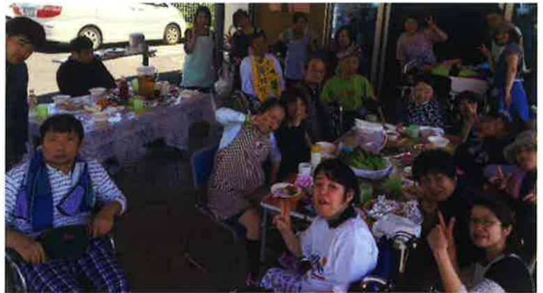
やさい やさい 〔BBQ〕野菜をカットしたりフルーツの盛り付けをしました☆