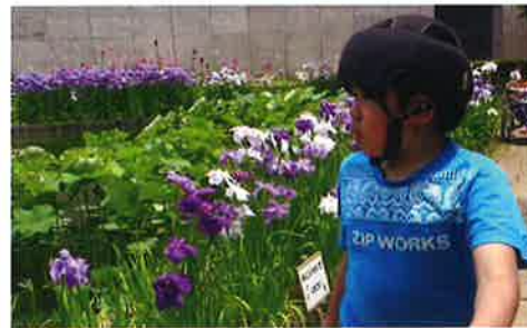
城北浄化センターで花菖蒲を見学してきました。とても綺麗でした！