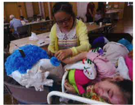
たなばたかざ しみずたなばた さんか みずいろ はな こいじょう かんせい 〔七夕飾り〕清水七夕まつりに参加します♪ 水色のお花は 400 個以上！そらの完成です。