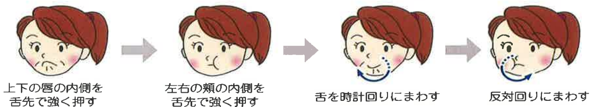
頬、口唇の内側を 1 周まわす

頭の体操 答え ①あげつち②せんげんちょう③ひじりいっしき④まりこ⑤みかどだい⑥まばせ ⑦うぶめ⑧みずみいろ⑨ねごや⑩むこうしきじ⑪きよじ⑫もばた⑬くつのや⑭しいのお⑮あご ⑰せきべ⑱とずらさわ⑲ぞう