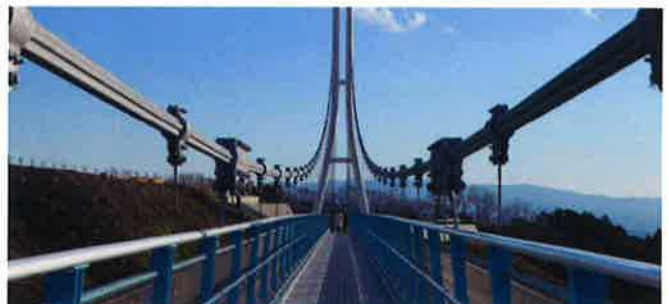
しゃしん 写真はホームページより