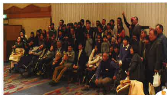
FOP 講演会の参加者の人たち

子供が最近 FOP と診断されたというご家族の方が来ていました。私も経験してきたことです。がやはり不安が大きいようです。