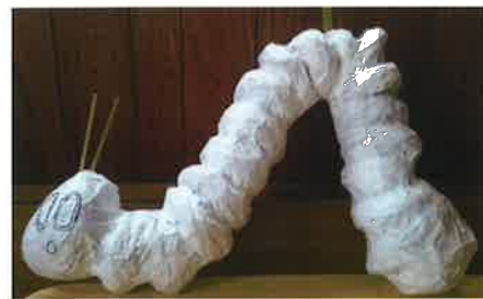
はらぺこあおむしを製作中です。7月の七夕祭りで清水銀座商店街に吊るされます。