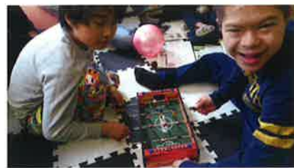
室内では、女の子には粘土や紙で作ったお寿司屋さんが人気。男の子には、サッカーの