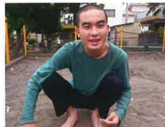
外遊びは、近くの公園でサッカー、大縄跳びに縄跳び、砂場が人気です！