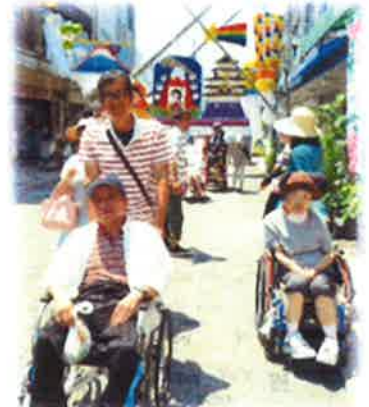
←☆そららを発見!! ☆ はっぴん