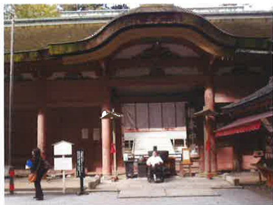
ひえいざんえんりやくじ 比叡山延暦寺

につぼんかくち りよこう かいご りようしやさま か だ くるま など りよう 日本各地を旅行されている介護サービスそらの利用者様も、貸し出し車いす等を利用し て旅行を楽しまれています。いせじんぐう じゃりせんようでんどうくるま 伊勢神宮では砂利専用電動車 いすのか だ りよう さいご かいだん かた ほじょ いすの貸し出しを利用し、最後の階段は NPO の方の補助で さんばい とつとりさきゆう すなち そうこう ふと つ 参拝し、鳥取砂丘では砂地を走行できる太いタイヤ付きの