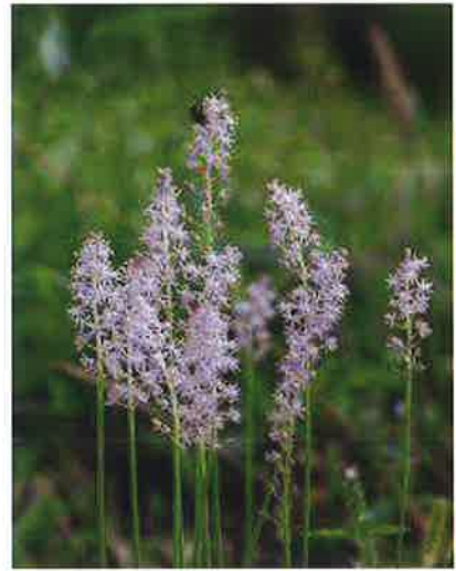
あき やそう 秋の野草 ルツボ

あき い しょくよく あき あき げいじゆつ あき など 秋と言えば「食欲の秋」「スポーツの秋」「芸術の秋」等、 れんそう ひと ちが こんかい 連想するものは人それぞれ違うのかもしれないね。今回 は、食欲の秋に因んで、おいしく食べる為の口腔ケアにつ いて調べてみました。