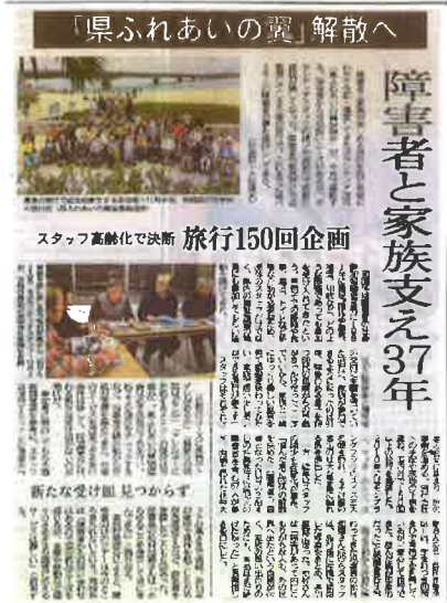
静岡新聞 平成29年12月18日(月)朝刊より

わたくし しょうがいしゃそうだんし えんじぎょう こんねんど かいさい じりつせいかつ 私 どもの障害者相談支援事業において今年度も開催している自立生活プログラムでは、 みな りょこう きかく おこな さまざま おも だ あ ちい ゆめ おお 皆さんと旅行の企画を行っています。様々な思いを出し合いながら、小さな夢をどこまで大 きくできるでしょうか？ご協力いただける方々のお声もお待ちしています。