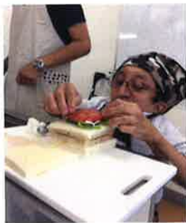
トマトは真ん中へ