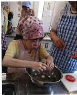
玉子はお水の中でむくのがコツ

6月19日(水)には一とぴあ清水の調理室にて、'Bakery ficelle'の山本店長ご夫妻を講師にお迎えしサンドイッチとピザトーストを作りました。実際に玉子をつぶしたり、包丁を持ち野菜やパンを切るなど、一人ではできない事に挑戦しました。麻痺があり片手が不自由でも爪楊枝や竹串でパンを抑えると切りやすくなるとコツを教えてくださいました。皆さんも是非、試してみてください。参加者の年齢や障害は様々でしたが、みなさん笑顔で和気あいあいと楽しく活動できました。