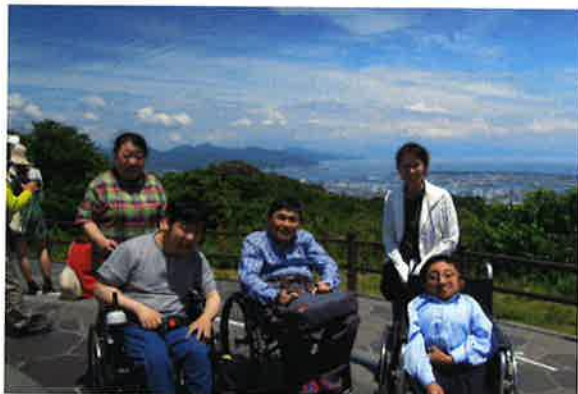
展望台から「ハイ、チーズ！」

今回、2か所の施設を見学してみて駐車場・通路や案内標示・多目的トイレ・エベーターなどいくつか