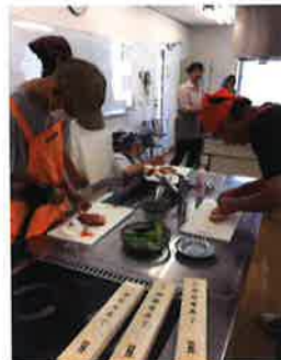
ピザトースト作っています