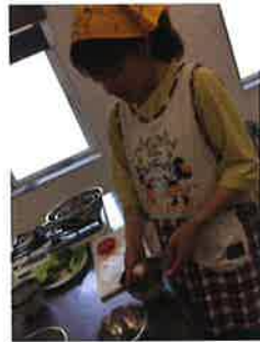
ほどよくつぶすのがコツ