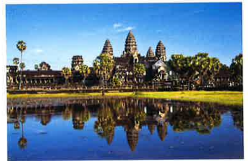
(カンボジア アンコールワット)

現在ではスマートフォンの普及に伴い、アプリケーションも向上し、外国の方とのコミュニケーションも容易になりました。これから、福祉業界も外国人労働者が増えることが予想されます。今度こそは良いコミュニケーションをとりたいたいものです。