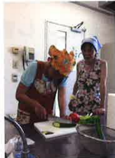
キュウリは大きな斜め切り