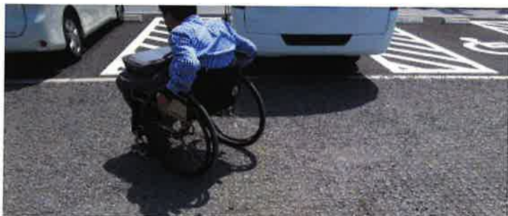
「みほしるべ」駐車スペースからリフトで降りると砂利…

か気になる所がありました。障がいの有無や年齢・性別に関係なく、誰もが使いやすいと何度も行きたくなる施設となるよう、今後も行政の方にも働きかけていこうと思います。