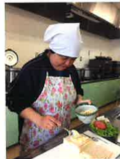
はみ出ないように慎重に