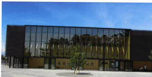
平日だからかな～!? お客様がいない