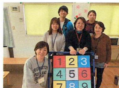
ほうかごどう 放課後等デイサービス ここ