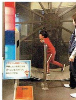
る・くるへ行ったよ