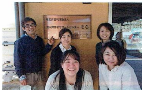
しょうがいしゃそうだんしきん 障害者相談支援