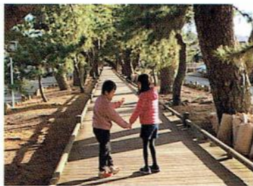
みほ まつばら 三保の松原

はる さくら き 春、桜がきれいに咲いています。 みんな 進学、進級おめでとうございます。 皆、お兄さん、お姉さんになりどんどん成長していきます。