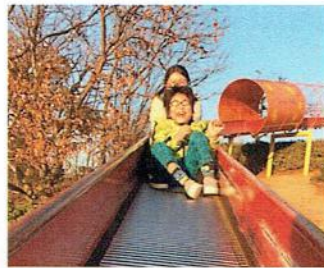
こうえん で 公園へお出かけ