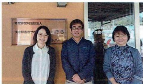
きょうたくかいごしきよ ホットハート居宅介護支援