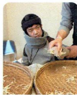
たくあん出来ました