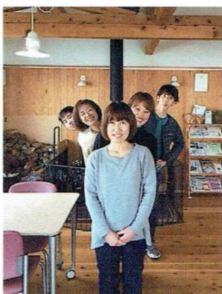
かいご 介護サービスそら