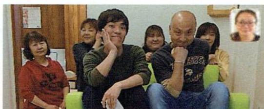
ほうかごどう 放課後等デイサービス どれみ