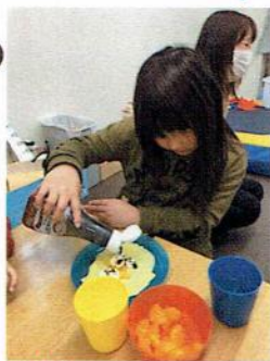
たの お楽しみおやつ♪