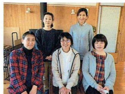
かいご ホットハート介護サービス