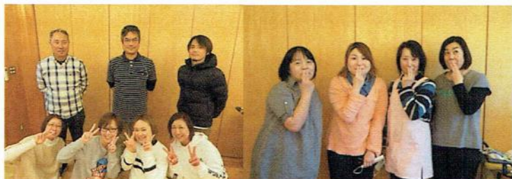
せいかつかいご 生活介護そら