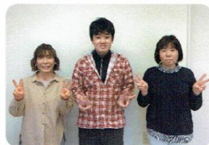
せいかつかいご 生活介護 ここ