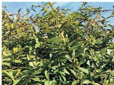
キャロライナジャスミンのつぼみ

植物を育てる行為によって、慈しみの心を育んだり、香りによって穏やかな気持ちになれたり、癒されたり、無心になり静かに自分と向き合ったり等、植物には人に作用する様々なパワーがあります。「園芸療法」の目的は、「植物の体験を通して心身の機能を改善し、リハビリテーションや治療、教育、レクリエーションに役立てていくこと」で、事の始まりは1972年アメリカで、日本へは1990年代初めに導入され、多くの幼稚園で植物を育てるプログラムが採用され、医療や福祉の分野でも取り入れられているそうです。