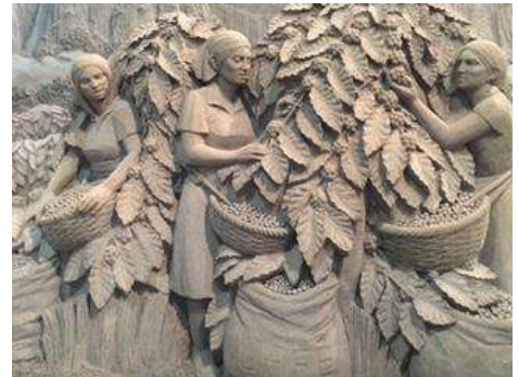
まいとし か てんじ 毎年テーマを変えて展示しています。