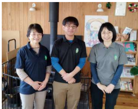
きょたくかいごしえん ホットハート 居宅介護支援