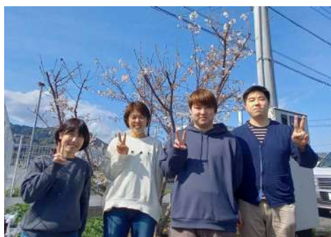
かいご 介護サービスそら