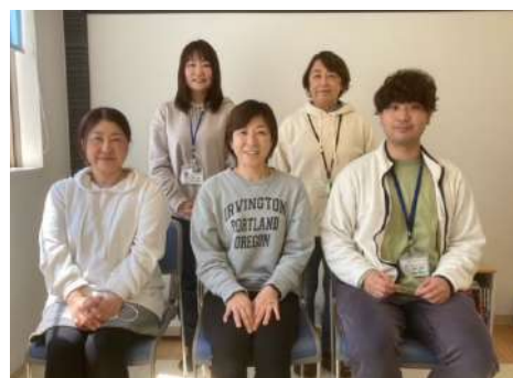
ほうかごとう 放課後等デイサービス ここ