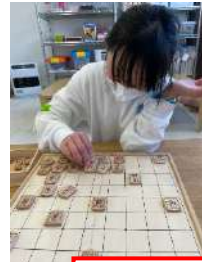
しょうぎ うでずもう つ 将棋・腕相撲・釣り