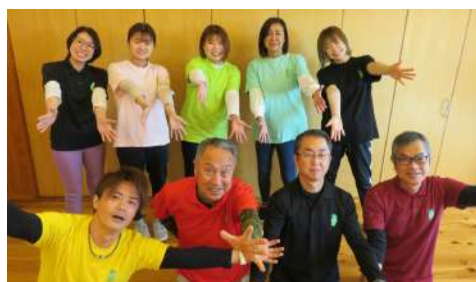
せいかつかいご 生活介護そら