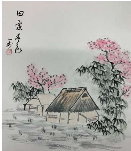
ふくいみ さえさま 福井美佐江様