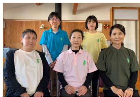
かいご ホットハート 介護サービス