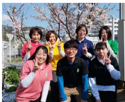
しょうがいしゃそうだんしえん 障害者相談支援