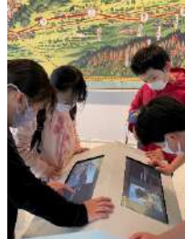
すんぶじょうこうえん 駿府城公園