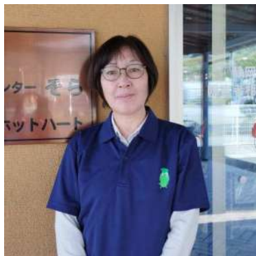
きたおえつ 北尾会津