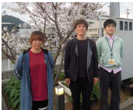
せいかつかいご 生活介護 ここ