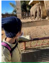
にほんだいらどうぶつ 日本平動物

ない うでずもう さいきん ここ内では、腕相撲や最近 しょうぎ しょうぎ みんな あたま では、将棋がブームで皆、頭 つか がんば を使って頑張っています。