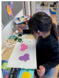
な はなこうさく 菜の花工作