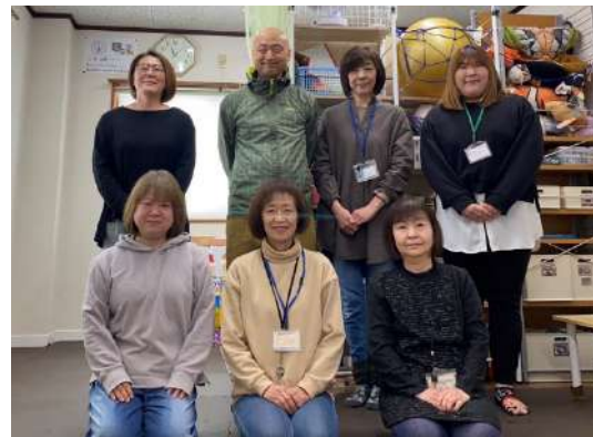
ほうかごとう 放課後等デイサービス どれみ