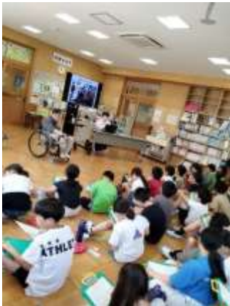
山本さんの生活は どんなかな?