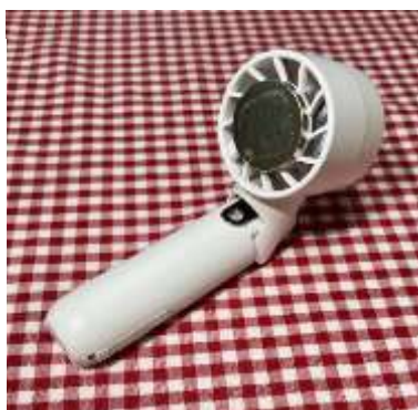
中心が冷たくなる扇風機