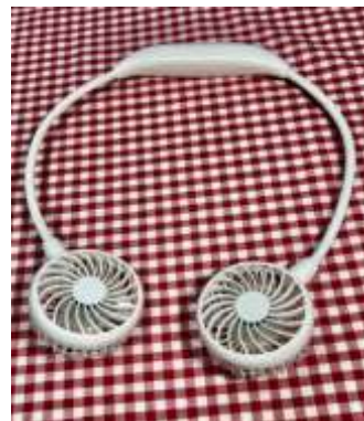
首掛けタイプの扇風機