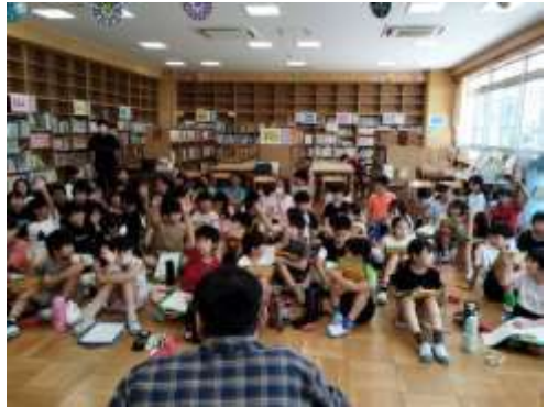
車いすで生活を教えてもらったよ。