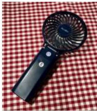
一般的なハンディ扇風機