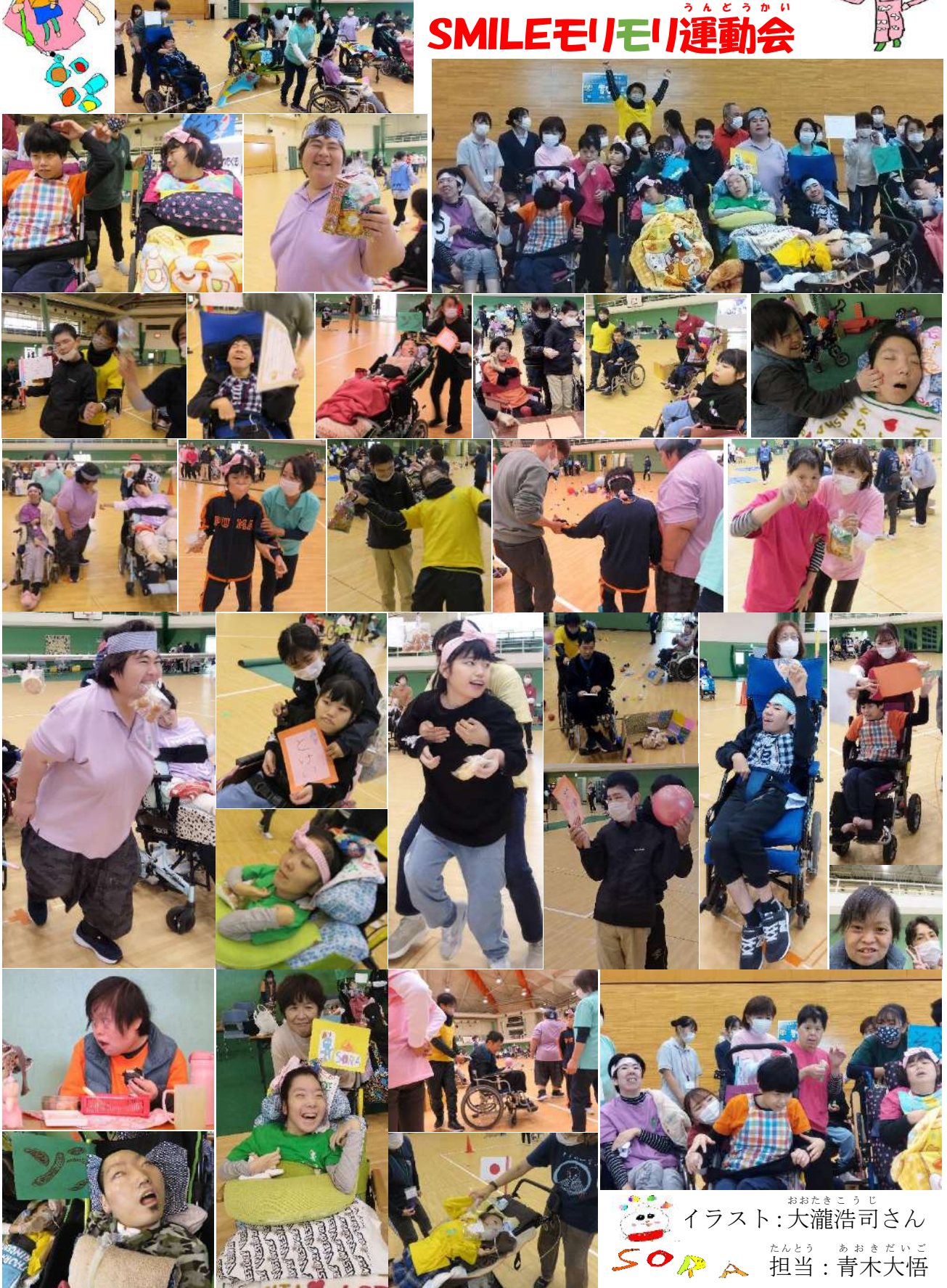
イラスト:大瀧浩司さん おおたきこうじ たんとう あおきだいご 担当:青木大悟